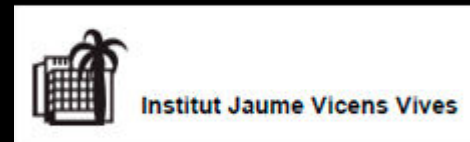
INS Jaume Vicens Vives (Girona) https://www.jvvgirona.eu/ca/