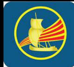
INS Dertosa (Tortosa) https://agora.xtec.cat/insdertosa/