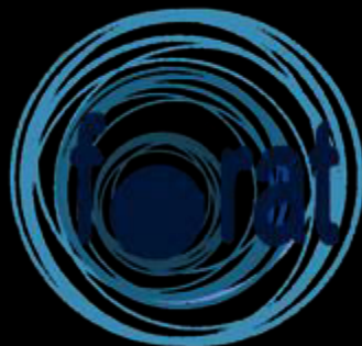
INS Forat del Vent (Cerdanyola del Vallès) https://agora.xtec.cat/iesforatdelvent/