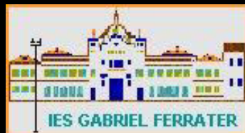
INS Gabriel Ferrater (Reus) https://agora.xtec.cat/iesgabriel Ferrater/